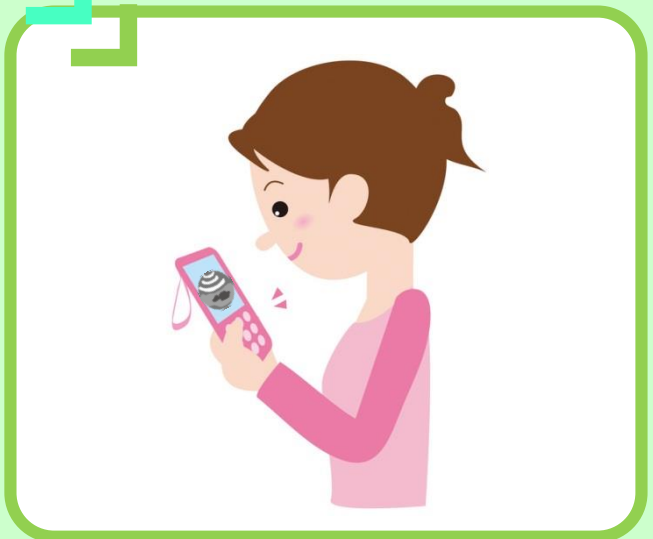
スマートフォン・パソコンよりエコー動画を閲覧できます